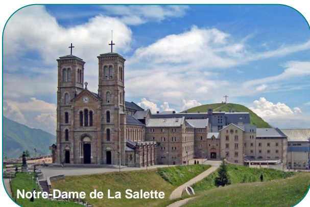
Notre-Dame de La Salette

Wir begegnen der Botschaft von La Salette mittels eines Videos. Gegen Abend findet die Versöhnungsfeier statt.