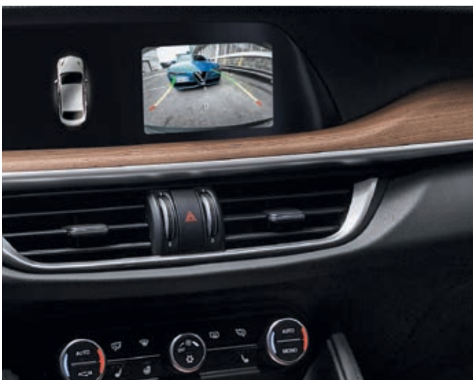
RÜCKFAHRKAMERA MIT DYNAMISCHEN FÜHRUNGSLINIEN