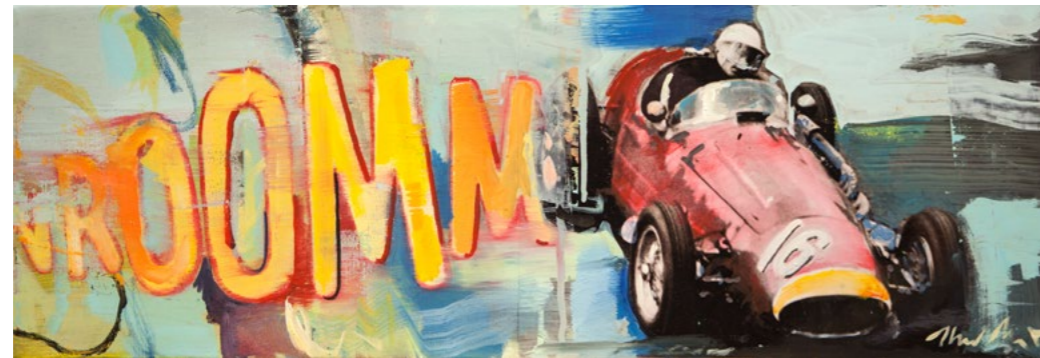
OBERN Racing Le Mans XI 2015 Öl auf Leinwand und Foto 21×60 cm