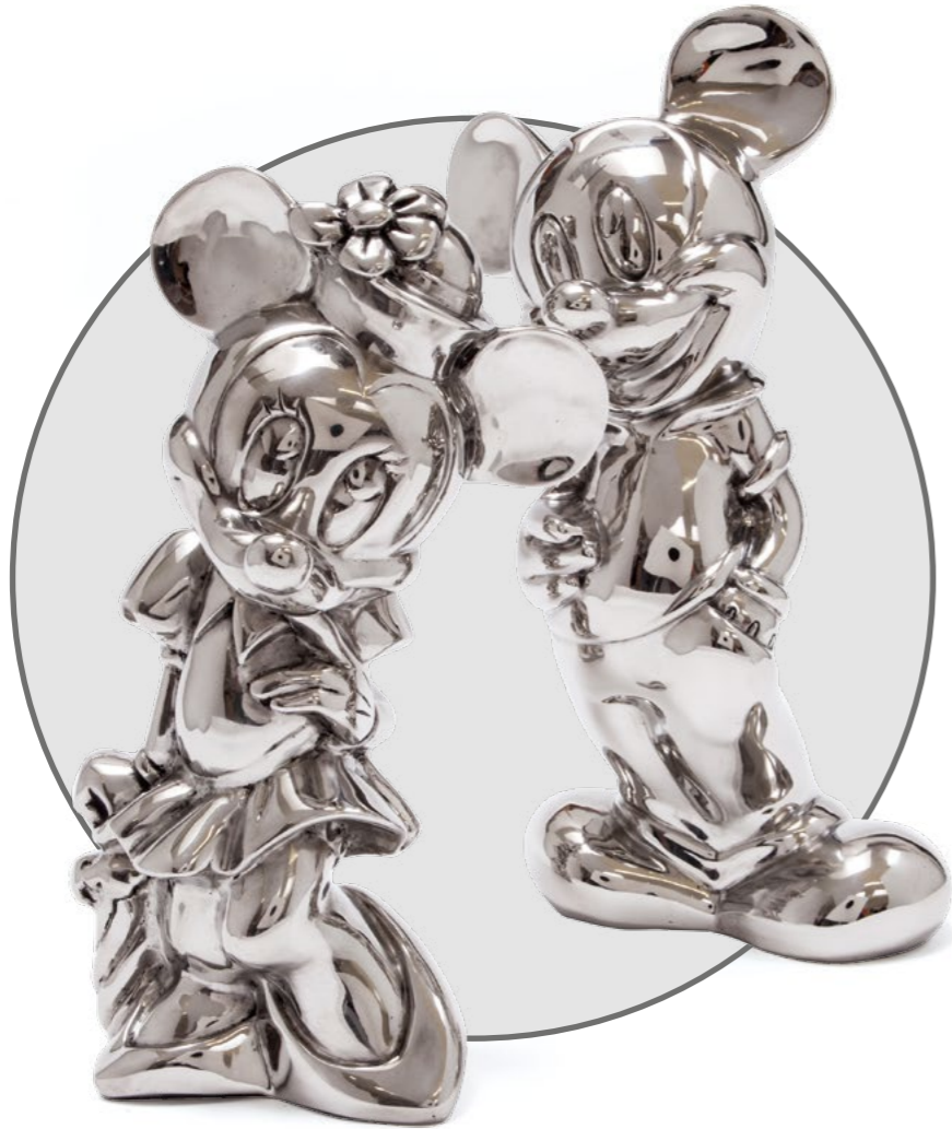
Ralphs → 2013 Öl auf Leinwand und Metall 92×107 cm