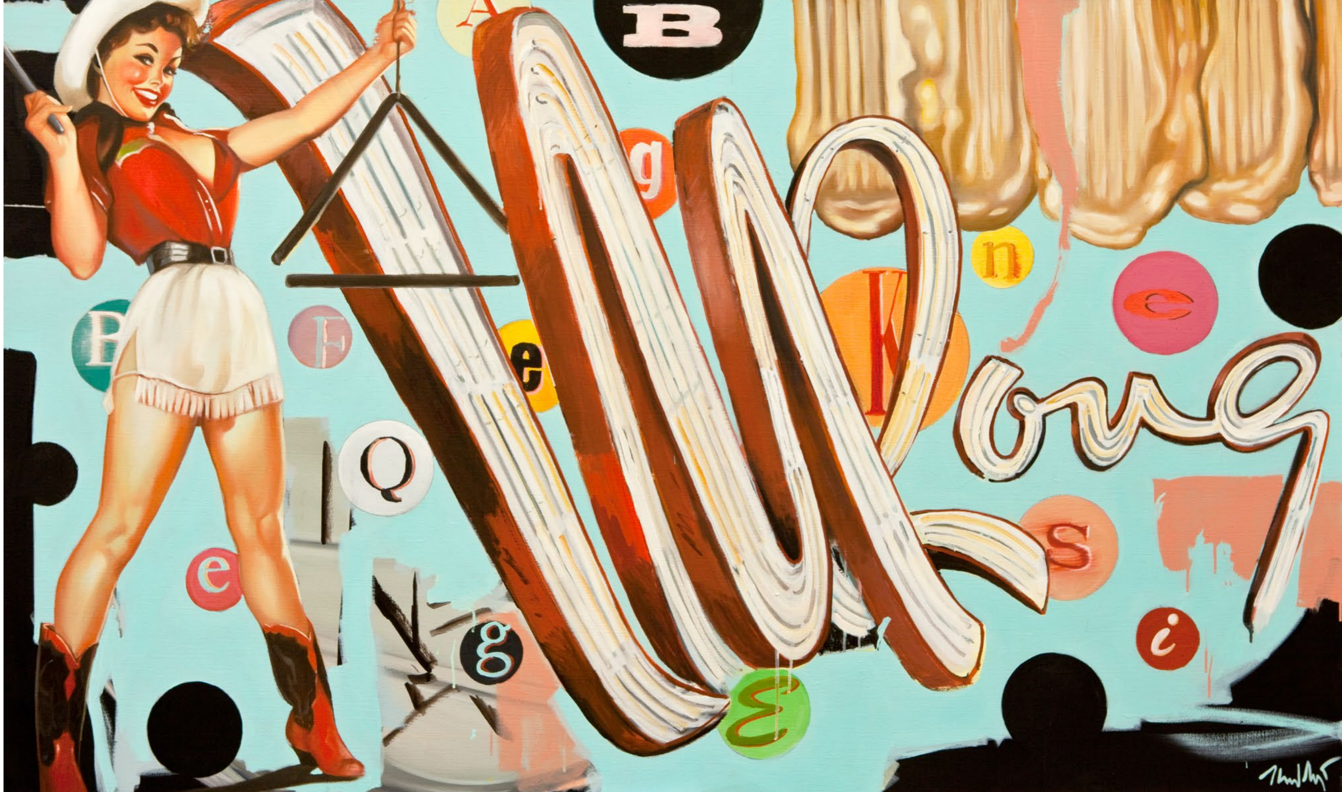
Neon Sign 2011 Öl auf Leinwand 100×165 cm