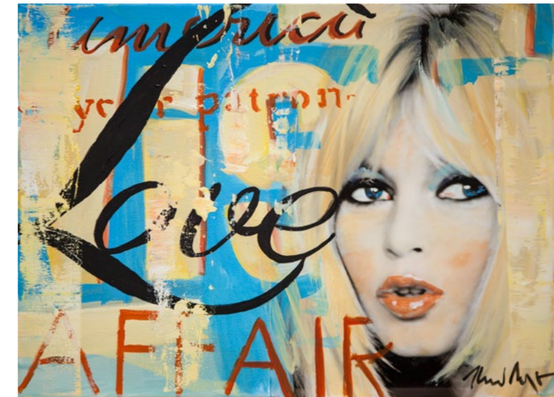
Same Size ← 2016 Öl auf Leinwand 100×120 cm