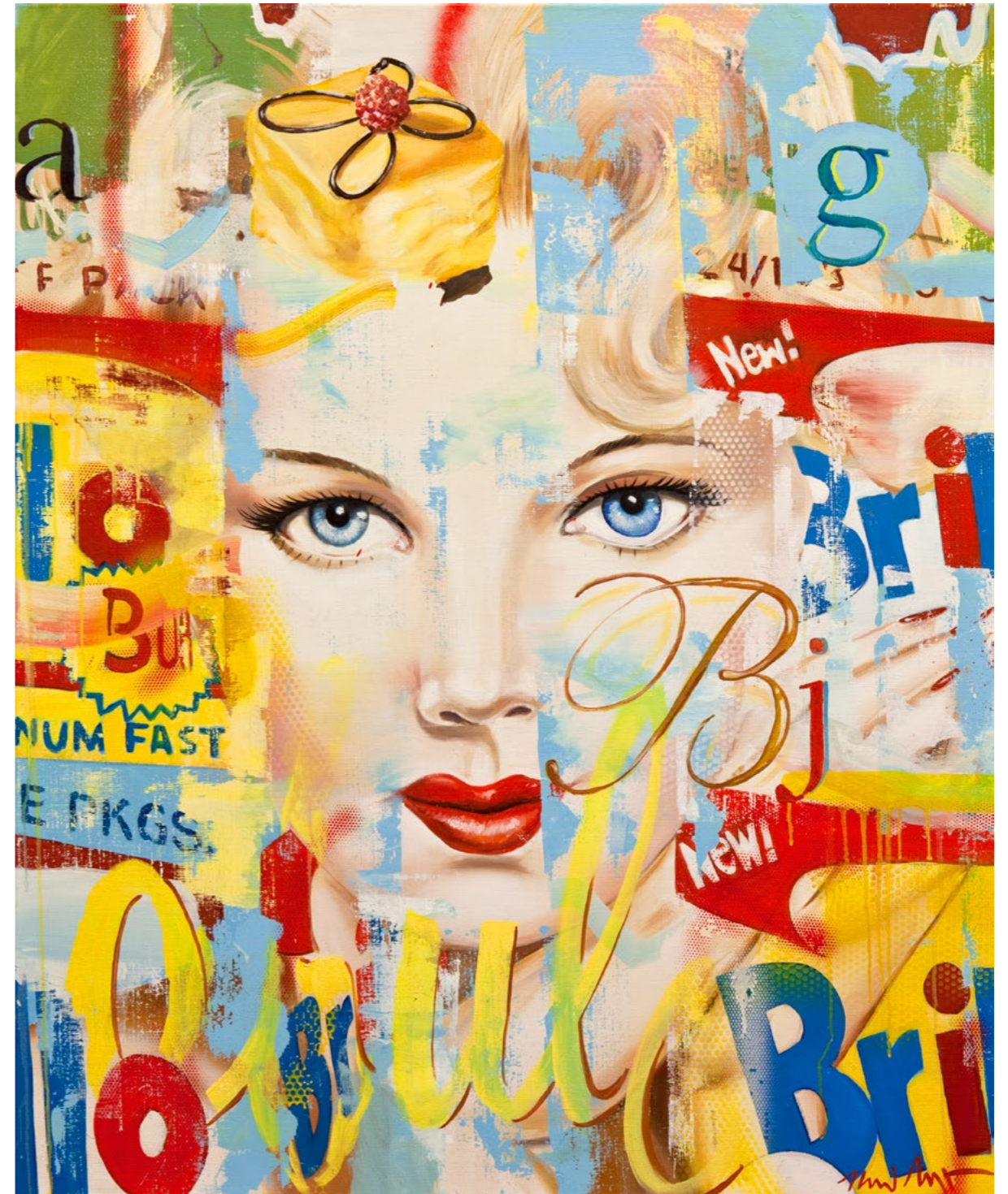
Miss Brillo II → 2011 Öl auf Leinwand 100×80 cm