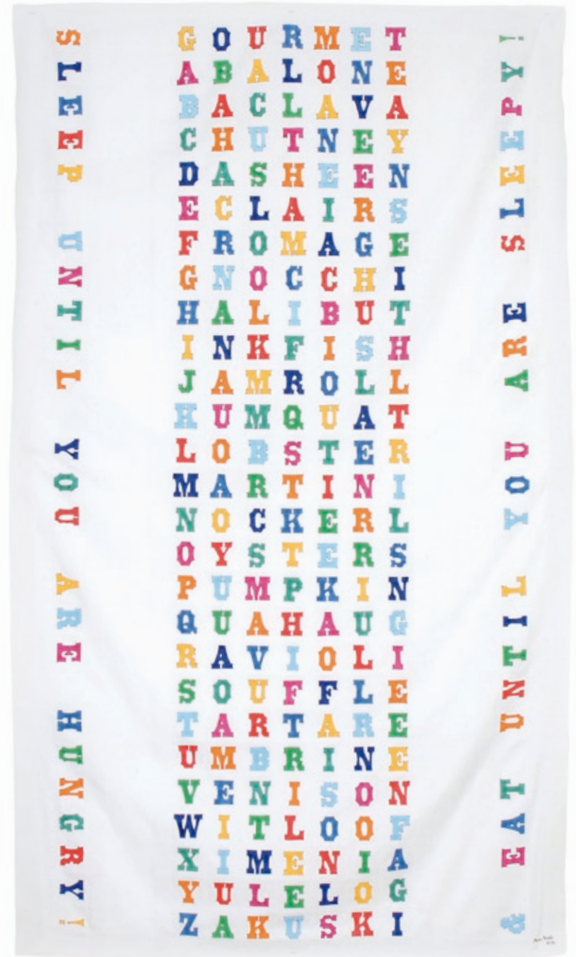
Gourmet Fare , 2011 Textilfarben auf Tischdecke aus Leinen, 214 x 122 cm Abb. Noël und Teske, Fluxus & Fotografie , callidus Verlag wissenschaftlicher Publikationen, 2011