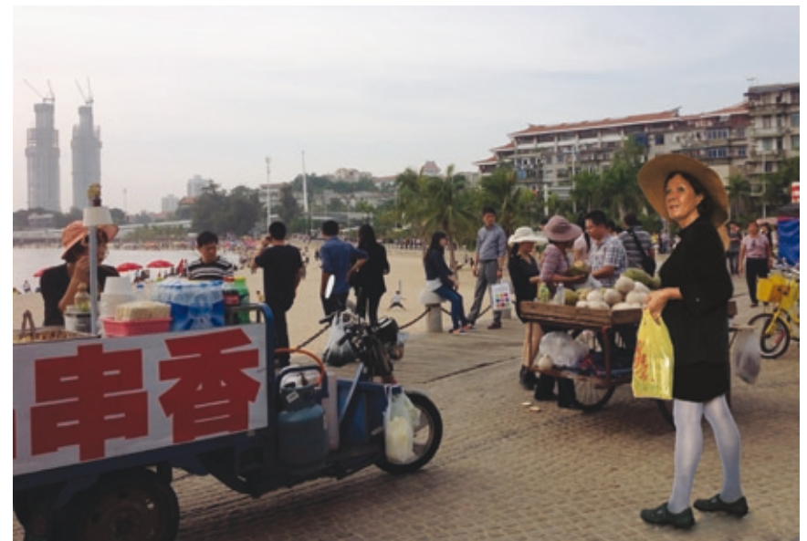
Beach Vendors at Xiada Baicheng, 2013–14

Fotomontage, Fine Art Print, 92 x 68.72 cm, Auflage: 3, 2 E.A.