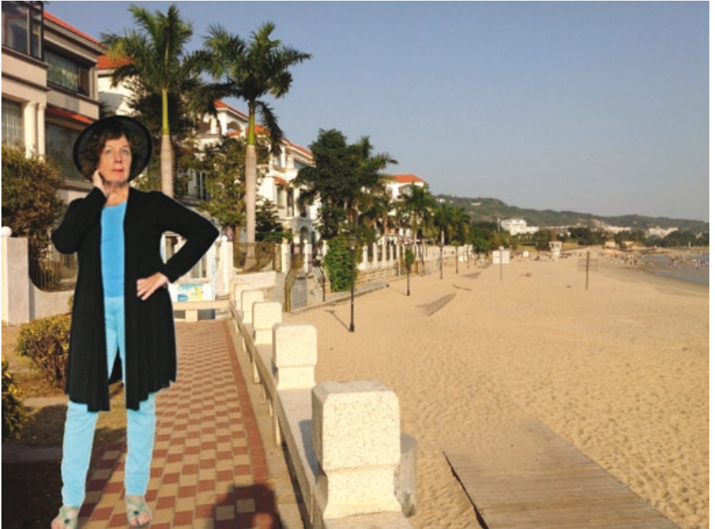
Beachfront Villas, ZengCuoAn, Xiamen, 2013–14 Fotomontage, Fine Art Print, 92 × 68.72 cm, Auflage: 3, 2 E.A.