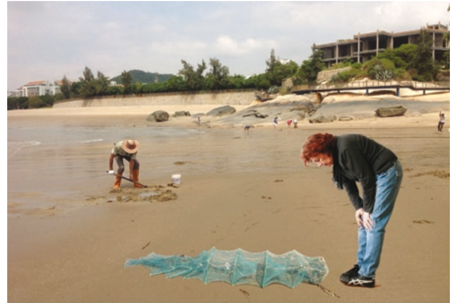
Digging for Worms, 2013–14

Fotomontage, Fine Art Print, 92 x 68.72 cm, Auflage: 3, 2 E.A.