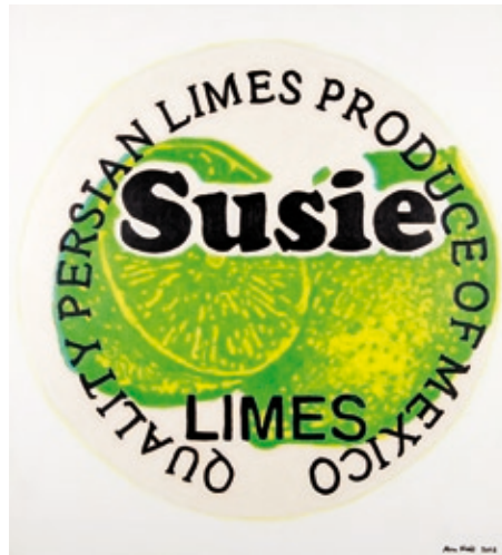
Susie , 2012 Acryl auf Leinwand, 73 x 67cm