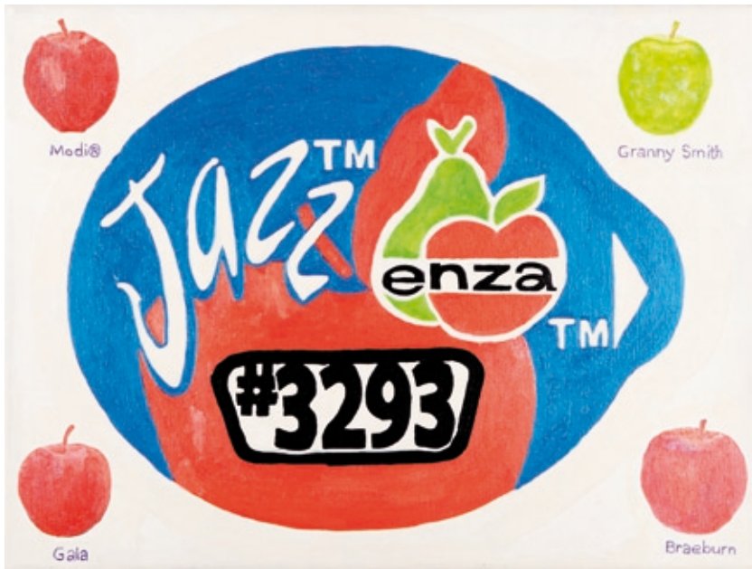
Jazz , 2014 Acryl auf Leinwand, 40 x 30 cm