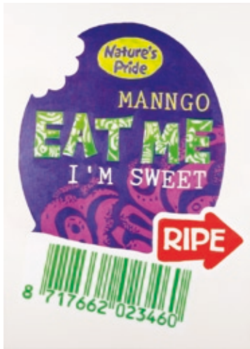
EAT ME , 2014 Acryl auf Leinwand, 70 x 50 cm