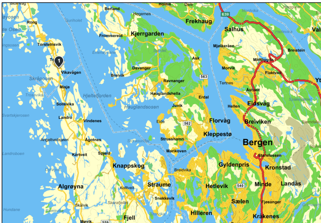
Figur 2. Oversiktskart. Planområdet er markert med nummer 1.