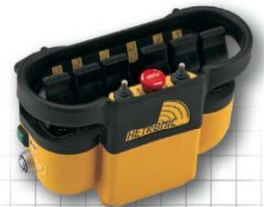
NOVA-L mit 6 prop. Bedienhebeln