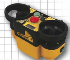
NOVA-L OEM Version Mit Grafikdisplay