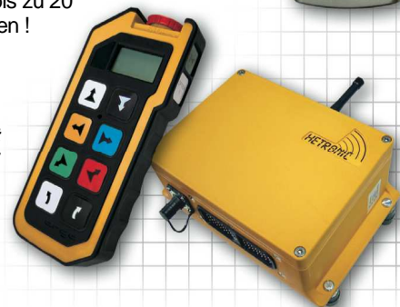
Ergo Sender mit Drucktaster