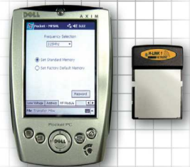
Pocket PC mit H-Link Software und Modem