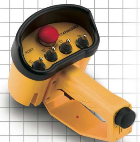
Sender HH mit Kippschaltern und optionalem Schutzaufsatz