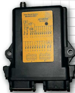
Empfänger MFSHL DC-16