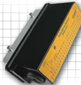
Empfänger MFSHL AC-16