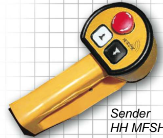
Sender HH MFSHL-2X2