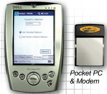
Pocket PC & Modem

Mit MFS ist eine Bedienung von bis zu 20 Sendern mit derselben Frequenz in näherer Umgebung möglich. Das heisst dass sich Bediener keine Gedanken über die Frequenzeinstellung machen müssen.