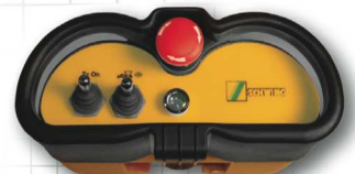
OEM Version für Mörtelpumpe

Der NOVA-S Sender in Kombination mit einem HETRONIC Empfänger versichert eine mühelose Integration des Maschinenschaltkreises.