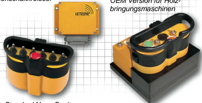
Standard Nova-S mit passendem Empfänger