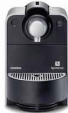
TK30N01CH September 2006

TK911N2CH Espresso-Gerät mit Nespresso System SN911 Aluminium/anthrazit